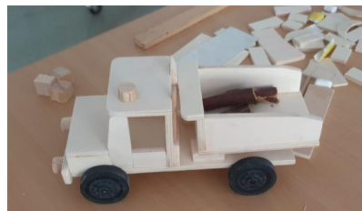
Werkstück „LKW“ Klasse 5

Ihr lernt mit Werkstoffen und Werkzeugen umzugehen und technische Verfahren anzuwenden. Dabei werden eure feinmotorischen Fähigkeiten und handwerklichen Fertigkeiten angesprochen und weiterentwickelt.