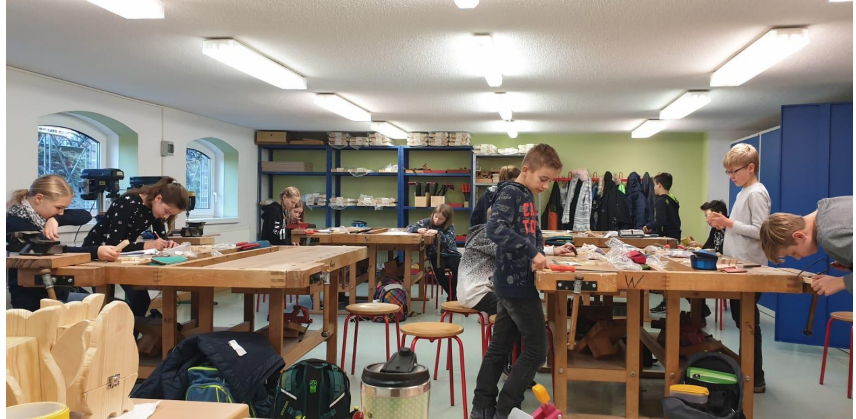
Fleißige SchülerInnen im Werkraum des Gymnasiums – Klein, aber oho 😊

Also seid gespannt! Wir freuen uns auf euch!