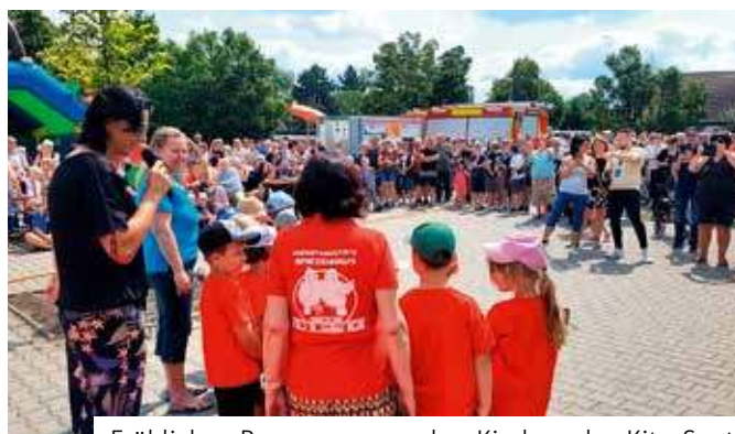
Fröhliches Programm von den Kindern der Kita Spatzenhaus