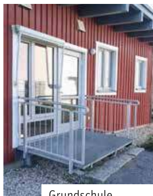
Grundschule Großlehna: Montage Geländer