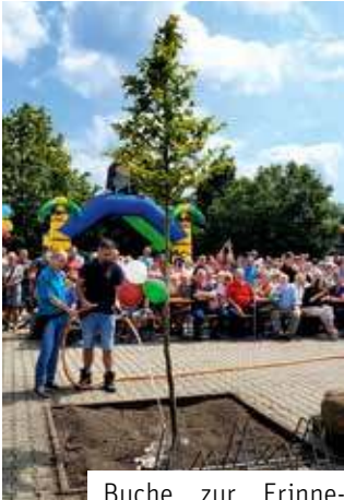
Buche zur Erinnerung der 800 Jahrfeier in Großlehna

erst die Tür für die konkrete Planung der Tante Enso-Filiale eröffnet haben. „In Zeiten, in denen viele Dörfer und Kleinstädte unter dem Verlust von Infrastruktur leiden, zeigt unser neuer Tante Enso Laden, dass wir gemeinsam dem Trend entgegenwirken können. Wir haben bewiesen, dass wir gemeinsam Großes erreichen können“, so Stittrich.