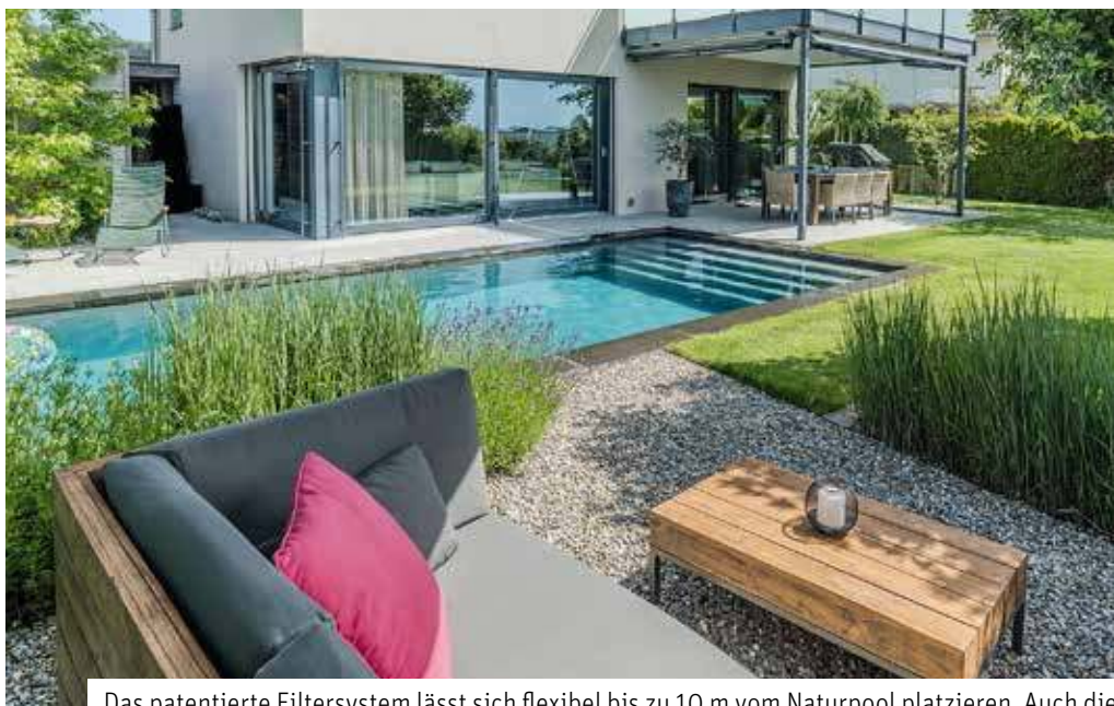
Das patentierte Filtersystem lässt sich flexibel bis zu 10 m vom Naturpool platzieren. Auch die Integration einer idyllischen Bepflanzung ist dank natürlichem Wasser ohne Chemie möglich.

Mehr unter www.teichmeister.de und www.gardenplaza.de/teichmeister sowie www.teichmeister.de/youtube , www.facebook.com/teichmeister.de , www.instagram.com/teichmeister.de und www.pinterest.de/teichmeister_naturpool .