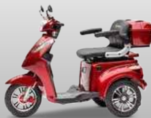
E-Drei- u. Vierradroller