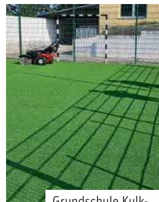
Grundschule Kulkwitz: Erneuerung Belag Bolzplatz

lung von Körper und Geist positiv und nachhaltig unterstützt. In einer Gesellschaft, in der immer mehr Tätigkeiten im Sitzen ausgeübt werden, ist das eine wertvolle Möglichkeit, diesem entgegenzuwirken. Deshalb soll der Platz zügig erneuert werden. Die umfangreichsten Maßnahmen stehen im Schulkomplex mit Oberschule und Gymnasium an. Neben Arbeiten an der Brand- und Einbruchmeldeanlage wurde das Fachkabinett für Biologie an der Oberschule für ca. 15.000 Euro grundhaft hergerichtet und mit neuen Tischen und Stühlen für rund 26.500 Euro ausgestattet. In diesem Zusammenhang werden ebenfalls moderne Mikroskope für rund 6.100 Euro angeschafft. Im Rahmen des Digitalpaktes Schule konnte in dem Raum eine Interaktive Tafel für ca. 4.000 Euro installiert werden. Auch am Schulkomplex werden darüber hinaus Unterrichtsräume saniert und neun Klassenzimmer mit einem effektiven Schallschutz ausgestattet.