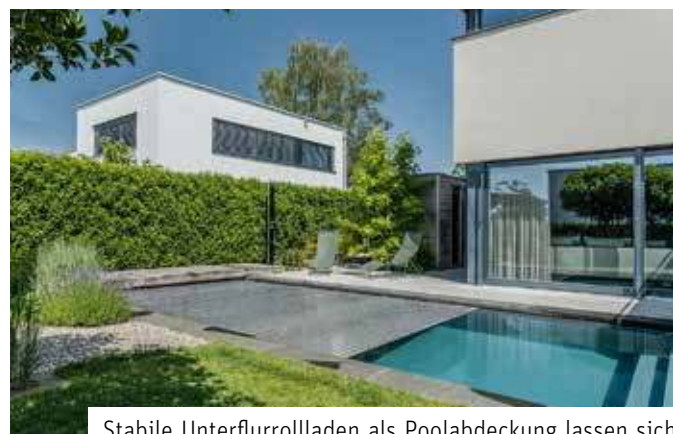
Stabile Unterflurrollladen als Poolabdeckung lassen sich problemlos ein- und ausfahren.