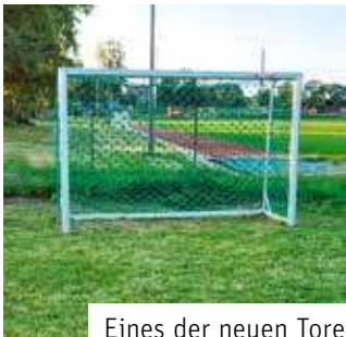
Eines der neuen Tore auf dem Bolzplatz in Gärnitz

Der Bolzplatz neben dem Sportplatz Gärnitz hat Dank der großen Unterstützung durch den SSV Kulkwitz neue Bolzplatz-Tore bekommen. Die alten Holztore auf dem bei unserer Jugend beliebten Platz waren in die Jahre gekommen und wurden vom TÜV gesperrt. Also was tun? Und so setzten sich die Sportfreunde des SSV Kulkwitz und