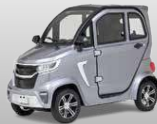
E-Drei- u. Vierrad-Kabinnenroller