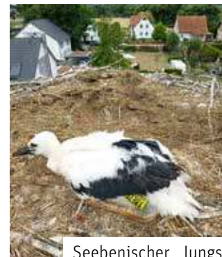
Seebenischer Jungstorch