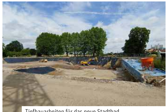
Tiefbauarbeiten für das neue Stadtbad

Die Arbeiten an dem neuen Stadtbad schreiten gut voran. Nach umfangreichen Tiefbauarbeiten werden die neuen Becken betoniert. Anschließend werden die Becken aus Edelstahl eingebaut. Diese werden voraussichtlich in Einzelteilen bis Ende August angeliefert. Die Montage erfolgt dann vor Ort. „Ich freue mich, dass wir beim Neubau unserer beliebten ‚Diva‘ so gut vorankommen.“, erklärt Bürgermeisterin Nadine Stitterich. Auf der ehemaligen Badfläche entsteht ein Schwimmbecken, das neben fünf Bahnen á 25 Meter einen Sprungturm mit 1-Meter- und 3-Meter-Plattformen umfasst. Weiterhin wird auf der Fläche ein Nichtschwimmerbecken mit einer breiten Rutsche sowie ein Planschwimmerbecken errichtet. Die Kostenschätzung für die gesamten Leistungen ergab einen Investitionsbedarf von ca. 6,8 Mio. Euro (brutto). Die Eröffnung ist zum Saisonstart 2025 geplant.