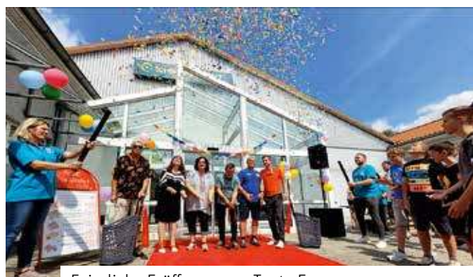
Feierliche Eröffnung von Tante Enso

Am 25. Juli 2024 war es endlich so weit. Eine Tante Enso-Filiale hat in Großlehna eröffnet. Der Andrang war groß. Zahlreiche Bürgerinnen und Bürger aus Altranstädt und Großlehna kamen,