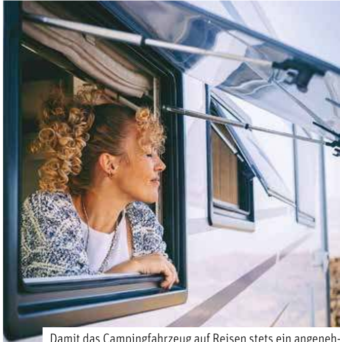
Damit das Campingfahrzeug auf Reisen stets ein angenehmer Rückzugsort bleibt, hilft ein abgestimmtes Klimatisierungskonzept.

Urlaub auf vier Rädern wird bei den Menschen in Deutschland immer beliebter. Bei aller Abenteuerlust und Spontaneität darf