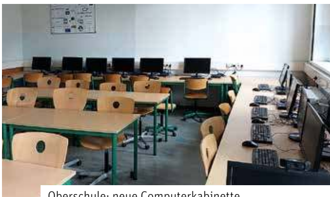
Oberschule: neue Computerkabinette

lästigung zu sorgen. Der Fußboden wird mit Epoxidharz und Einstreu ausgegossen, so entfallen auch hier die Fugen. Die Urinale bei den Jungen sind mit einer automatischen Spülung ausgestattet. Für die Sanierung beider WC-Anlagen wurden rund 80.000 Euro investiert.