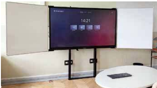
Gymnasium: neue Interaktive Tafeln