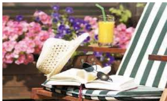
Wohnen mit Urlaubsfeeling...

Lützen, Gustav-Adolf-Str. 11, EG HH, EBK, Bad m. Wanne, Laminat, BF, Außenjalousien 48,42 m 2 für 315 € kalt / 507 € warm Bj: 1880, G, V, 258 kWh (m 2 a)