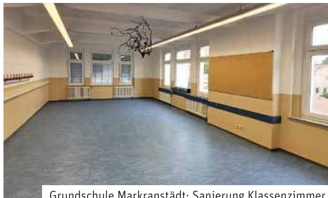
Grundschule Markranstädt: Sanierung Klassenzimmer

An der Grundschule Kulkwitz wurde der Bolzplatz mit einem neuen Kunstrasen versehen. Das Angebot des Bolzplatzes an der Grundschule wird gut nachgefragt. Denn die Leidenschaft, Fußball zu spielen, ist nicht erst seit der laufenden Fußballeuropameisterschaft in Deutschland bei fast allen Kindern besonders groß. Bewegung wird dadurch gefördert und die Entwick-