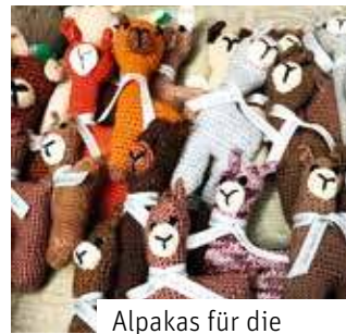
Alpakas für die Schulanfänger 2024