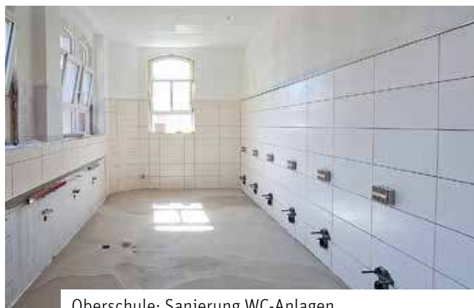
Oberschule: Sanierung WC-Anlagen

Der Zustand der Toilettenanlagen ist immer ein Thema an Schulen und in den Medien. Sowohl für Mädchen als auch Jungen wird jeweils eine WC-Anlage umfänglich hergerichtet. Beide Anlagen erhalten neue Fliesen und einen neuen Fußboden. Die Fliesen sind verhältnismäßig groß gewählt, um Fugen zu reduzieren und für mehr Sauberkeit und weniger Geruchsbe-