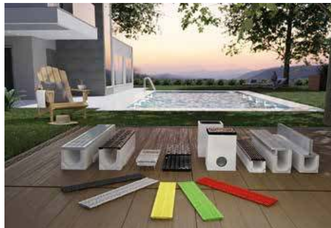
BIRCO bietet ein umfangreiches Sortiment für effiziente Entwässerungslösungen, die für jeden Bedarf, Belastungsgrad und Geschmack die passende Variante bereithalten.

palette ganz einfach die persönliche Lieblingsfarbe ausgewählt werden. Auch für die Punktentwässerung bietet BIRCO mit der BIRCOlight eine effiziente Systemerweiterung mit einem Gewicht von 48,5 Kilogramm, die über einen Sinkkasten und einen integrierten Geruchsverschluss verfügt. Etwas kleiner, leichter und mit einer optisch ansprechenden Gitterrost-Abdeckung versehen ist die generalüberholte BIRCOplus-Punktentwässerung. Weitere Infos unter www.birco.de .