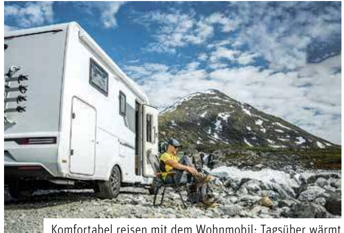
Komfortabel reisen mit dem Wohnmobil: Tagsüber wärmt die Sonne, nachts die Standheizung.

der Komfort im Campervan oder Reisemobil nicht zu kurz kommen. Auch an heißen Sommertagen sollen dank einer Klimatisierung angenehme Temperaturen im Fahrzeug herrschen, um einen erholsamen Schlaf zu ermöglichen. Für Touren in der kühleren Jahreszeit wünschen sich viele wiederum eine effektive Reisemobilheizung. Geeignete Lösungen von Webasto etwa eignen sich für unterschiedliche Fahrzeuggrößen und Reiseziele. Wer beide Systeme, sowohl Aufdachklimaanlage als auch Reisemobilheizung, gleichzeitig nachrüsten lässt, kann viel Zeit und Kosten sparen. Unter www.webasto.com gibt es weitere Tipps und Adressen von Fachwerkstätten in der Nähe. DJD