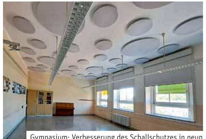
Gymnasium: Verbesserung des Schallschutzes in neuen Klassenzimmern

Auch in diesem Jahr hat die Stadt Markranstädt die Ferienzeit für umfangreiche Instandhaltungs- und Wartungsarbeiten genutzt. Auch die Digitalisierung der Markranstädter Schulen wurde fortgeführt. Für die gesamten Maßnahmen an den Grundschulen Markranstädt, Kulkwitz und Großlehna sowie der Oberschule Markranstädt und dem Hannah-Arendt-Gymnasium werden im Sommer insgesamt beachtliche rund 250.000 Euro zuzüglich ca. 32.600 Euro für die Ausstattung und im Rahmen des Digitalpaktes Sachsen weitere 43.000 Euro ausgegeben. Auf den Seiten 8 und 9 lesen Sie mehr über die vielfältigen Aktivitäten.