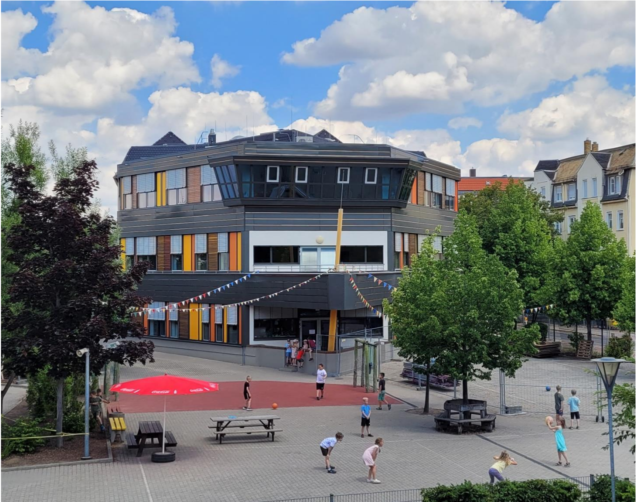
Erweiterungsbau Grundschule Markranstädt