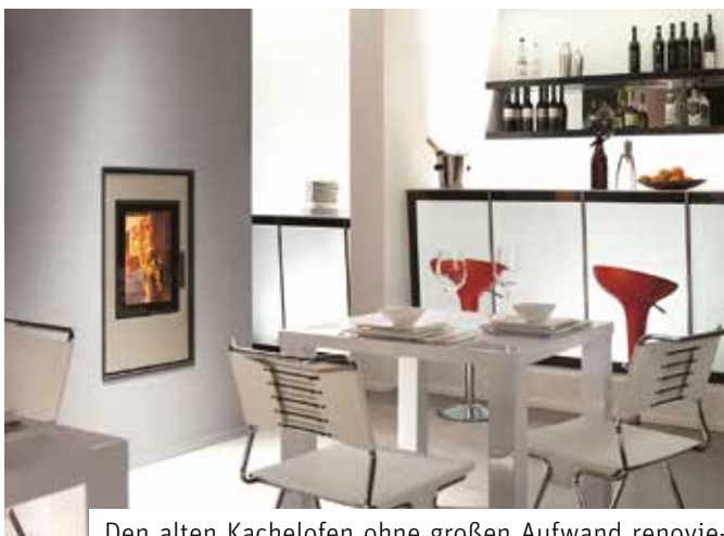
Den alten Kachelofen ohne großen Aufwand renovieren.

Bis Ende 2017 müssen alle alten Kachelofeneinsätze mit einer Typprüfung vor 1985 stillgelegt, nachgerüstet oder ausgetauscht werden, wenn sie die vorgegebenen Grenzwerte nicht erfüllen. Dies schreibt die Erste Verordnung zur Durchführung des Bundes-Immissionsschutzgesetzes (1. BImSchV) vor. In vielen, in die Jahre gekommenen Kachelöfen, entsprechen die technisch veralteten Heizeinsätze nicht mehr den aktuellen Umweltschutzrichtlinien. Letztendlich haben diese Heizeinsätze über 30 Jahre lang in der kalten Jahreszeit allabendlich für wohlige Wärme gesorgt.