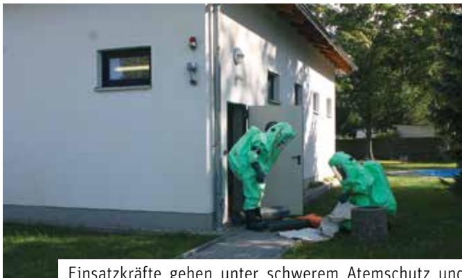
Einsatzkräfte gehen unter schwerem Atemschutz und Chemikalienschutzanzügen in den Gefahrenbereich vor