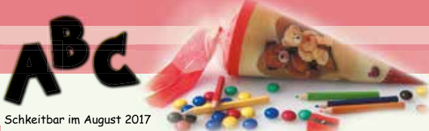
Schkeitbar im August 2017