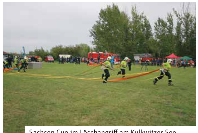
Sachsen Cup im Löschangriff am Kulkwitzer See

Der September stand im Zeichen der Freiwilligen Feuerwehr. Bereits am 9. September fand neben den Feierlichkeiten zum Jubiläum 150 Jahre FF Markranstädt der Sachsen Cup, die Kreismeisterschaft sowie der Bürgermeisterpokal im Löschangriff statt. Eine Übersicht zu den Ergebnissen finden Sie im Innenteil. Die Stadt Markranstädt gratuliert vielmals auch zum guten Abschneiden der Markranstädter Feuerwehrfrauen. Weiterhin wurde am 16. September im Stadtbad Markranstädt der Ernstfall Chlogas geübt. Dabei haben die Ortswehren Markranstädt, Döhlen/Quesitz, Lindennaundorf, Großlehna/Altranstädt und Gärnitz gemeinsam mit dem Gefahrgutzug Süd und Erkundungszug sowie dem Kreisbrandmeister des Landkreises Leipzig bei einem technischen Defekt an der Chlogasanlage im Stadtbad den Gasaustritt simuliert. Im Mittelpunkt der Übung standen die Zusammenarbeit der Wehren und die Intensivierung der Kommunikation. Lesen Sie mehr auf Seite 4.