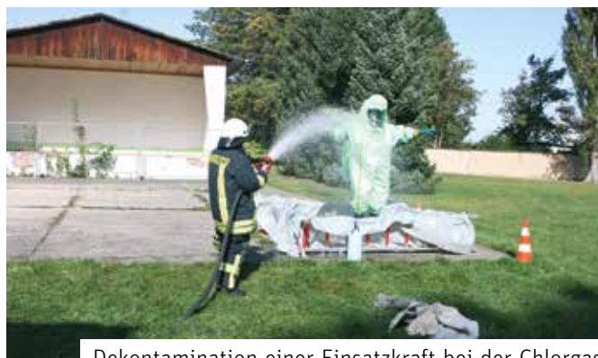
Dekontamination einer Einsatzkraft bei der Chlorgasübung im Stadtbad

Am 16. September 2017 probten die Ortsfeuerwehren Markranstädt, Döhlen / Quesitz, Lindennaundorf, Großlehna / Altranstädt und Gärnitz gemeinsam mit dem Gefahrgutzug Süd und Erkundungszug sowie dem Kreisbrandmeister des Landkreises Leipzig den Ernstfall eines Chlorgasaustrittes. Es wurde davon ausgegangen, dass eine Chlorgaswolke Richtung Nord-Os-