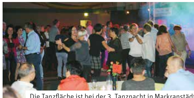
Die Tanzfläche ist bei der 3. Tanznacht in Markranstädt gut gefüllt