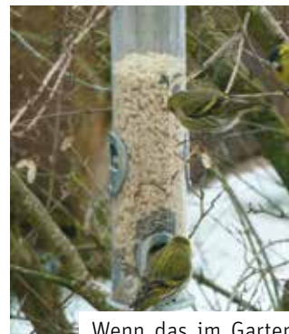
Wenn das im Garten angebotene Futter verschiedene Vogelarten ...

Wer statt an einem Vogelfutterhäuschen die gefiederten Freunde lieber direkt in Baum und Strauch füttern mag, verwendet dazu sinnvoller Weise Meisenknödel oder, noch besser, sogenannte Vogelschmäuse. Diese sind so ausgetüftelt, dass beim Aufhängen nur der untere Teil der Plastikverpackung entfernt wird, während der obere als eine Art Mantel das Futter vor Wettereinflüssen schützt. Das etwas breitmaschigere Netz der Vogelschmäuse sorgt dafür, dass beim Bepicken immer auch etwas Futter herunter fällt. Das ist Absicht: Denn so werden auch diejenigen Vogelarten versorgt, die ihre Nahrung üblicherweise am Boden aufnehmen, beispielsweise Amseln oder Rotkehlchen.