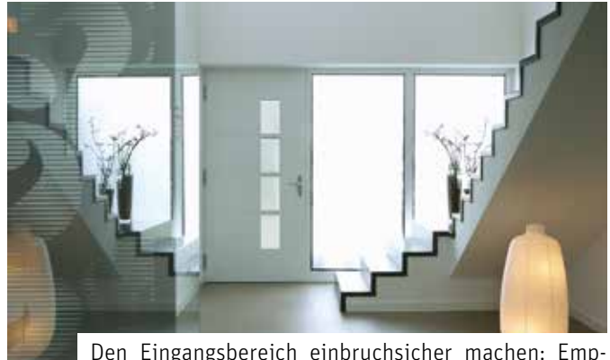
Den Eingangsbereich einbruchsicher machen: Empfohlen werden heute Haustüren, die den sogenannten Widerstandsklassen RC 2 oder 3 entsprechen.

Haustüren, die seit 15 oder 20 Jahren in Gebrauch sind, können mit heutigen Sicherheitsstandards naturgemäß nicht mehr mithalten. Empfohlen werden Türen, die den Widerstandsklassen RC 2 oder 3 entsprechen. Mit diesen offiziellen Kategorien wird beschrieben, wie lange eine Tür verschiedenen Einbruchversuchen mit Werkzeugen standhält. Sowohl im Neubau als auch bei der Modernisierung sollten Hauseigentümer also auf eine