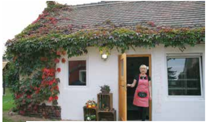
Einfach. Natürlich. Nachhaltig. Gesund. Besser. Leben. / Regional und Bio frisch auf den Tisch! / Gesund essen kann so leicht sein! / Zurück zum Ursprung

Unser Laden ist die gesunde alternative zum Supermarkt. Chemie- und Gentechnikfrei, ohne Konservierungsstoffe, unbehandelt und naturbelassene Produkte frisch im Regal. Das Angebot ist vielfältig und passt sich Ihren Wünschen an. Neben qualitativ hochwertigen Lebensmitteln aller Art bieten wir ein übersichtliches Sortiment anderer Waren des täglichen Bedarfs wie Pflegeprodukte, Naschereien oder Tierfutter an. Außerdem gibt es täglich ofenfrische Brötchen, Brot und Kuchen sowie Kaffee und