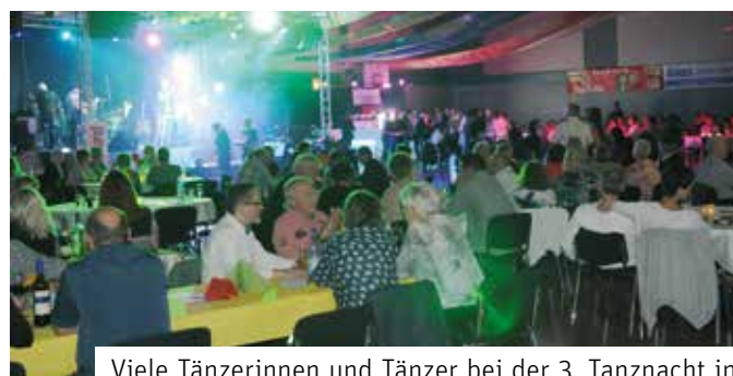
Viele Tänzerinnen und Tänzer bei der 3. Tanznacht in Markranstädt