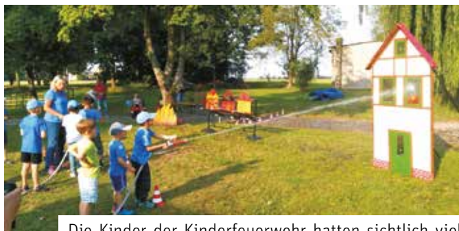
Die Kinder der Kinderfeuerwehr hatten sichtlich viel Spaß mit den Wasserspielen

Von den Kindern mit Spannung erwartet und von den Mitgliedern des Fördervereins mit großem Engagement vorbereitet, fand am 25. August das 1. Sommerfest unserer Kinder-Feuerwehr statt. Auf dem Gelände rund um die Feuerwehr in Döhlen sorgten die Hüpfburg aus Markkranstädt und das Spielmobil aus Lippendorf für Spiel und Spaß. Das mit den Kindern gesammelte Holz brannte in einer Feuerschale und das darin gebackene Stockbrot fand mehr Anklang bei den Jüngsten als diverse Schmeckerchen vom Grill. Zu diesen gab es hausgemachte Salate und viele Gelegenheiten für nette Gespräche und ein entspanntes Miteinander. Auch im Namen des Fördervereins bedanken wir uns an dieser Stelle noch einmal ganz herzlich für die Anschub-Unterstützung durch die Vereine der Feuerwehren Döhlen/Quesitz und Großlehna.