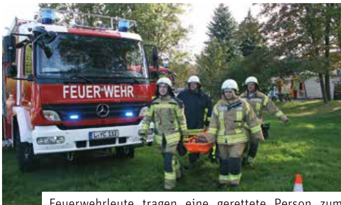
Feuerwehrlaute tragen eine gerettete Person zum Sammelplatz für Verletzte

ten zieht. Weiterhin werden 20 Verletzte vermutet. Geübt werden das Vorgehen bis zur Rettung der Verletzten und die Übergabe an den Rettungsdienst. Aufgrund der Lage „Ernstfall Chlorgasausbruch“ wurden neben den örtlichen Feuerwehren der Gefahrenzug und Erkundungszug des Landkreises Leipzig alarmiert. Ziel der Übung war es, die Zusammenarbeit zwischen den beteiligten Wehren über die Stadtgrenze hinaus zu intensivieren und die Kommunikation zu testen.