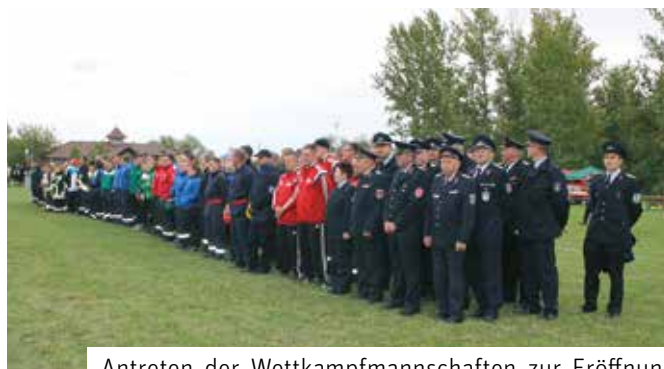
Antreten der Wettkampfmannschaften zur Eröffnung der Feuerwehrwettkämpfe

Am 09. September 2017 fand am Westufer des Kulkwitzer Sees der Sachsen Cup im Löschangriff des Landesfeuerwehrverbandes Sachsen statt. Gewonnen wurde der Wettstreit der Sächsischen Feuerwehren von Lauba. Auf Platz zwei landete FF Dürrhennersdorf, dritter wurde Preititz. Zeitgleich wurden die Kreismeisterschaften des Kreisfeuerwehrverbandes Landkreis Leipzig veranstaltet. Die Frauen der Freiwilligen Feuerwehr Markranstädt belegten hier den 1. Platz. Bei den Männern gewann Beucha vor dem Team Landkreis Leipzig und Ballendorf. Anlässlich des Jubiläums 150 Jahre Freiwillige Feuerwehr Markranstädt wurde auch der Wanderpokal des Bürgermeisters ausgelobt. Die FF Markranstädt Mix errang den Pokal vor Döhlen und Markranstädt für sich. Wir gratulieren den Teams für ihren guten Erfolg. Für Groß und Klein war es ein anschauliches Spektakel diesen Wettstreit am Kulkwitzer See erleben zu dürfen.