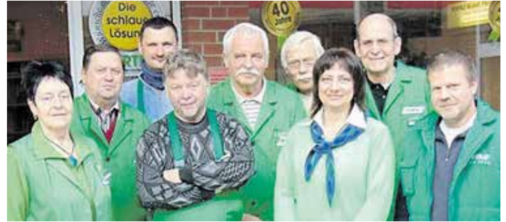
Unser erfahrenes Team berät Sie sehr gern.

Portas-Spanndecken schaffen Atmosphäre und Behaglichkeit ohne aufwändige Maler- und Verputzarbeiten. Der Einbau von Strahlern ist möglich, aber auch das Integrieren einer vorhandenen Lampe ist kein Problem.