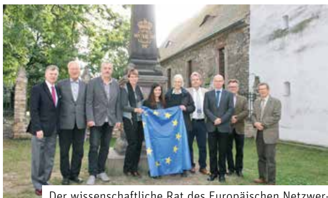
Der wissenschaftliche Rat des Europäischen Netzwerkes „Places of Peace“ (ENPP) zu Gast in Altranstädt

Der Förderverein Schloss Altranstädt e. V. kam als Gründungsmitglied des ENPP der Bitte des Vorsitzenden des ENPP, Herrn Eduardo Basso aus Portugal, nach und veranstaltete das Treffen in den Räumen des Schlosses.